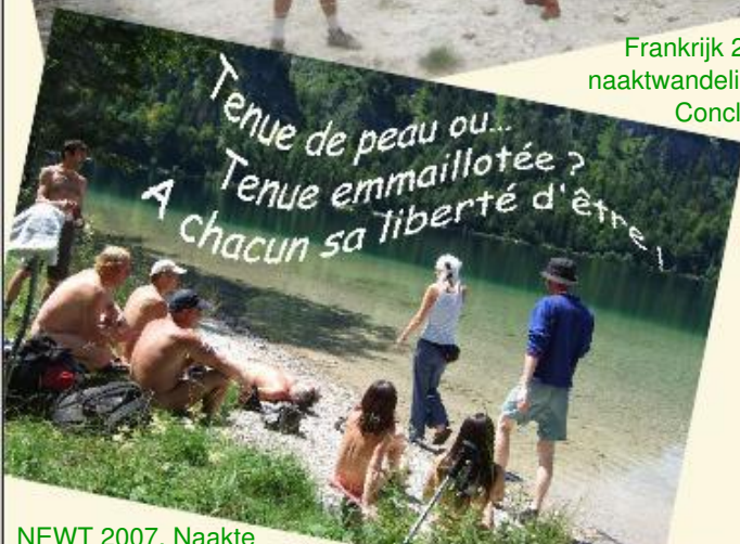
NEWT 2007, Naakte trektocht door Oostenrijk