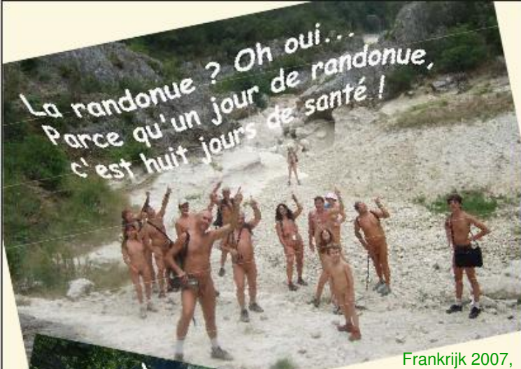
Frankrijk 2007, naaktwandeling in Concluses